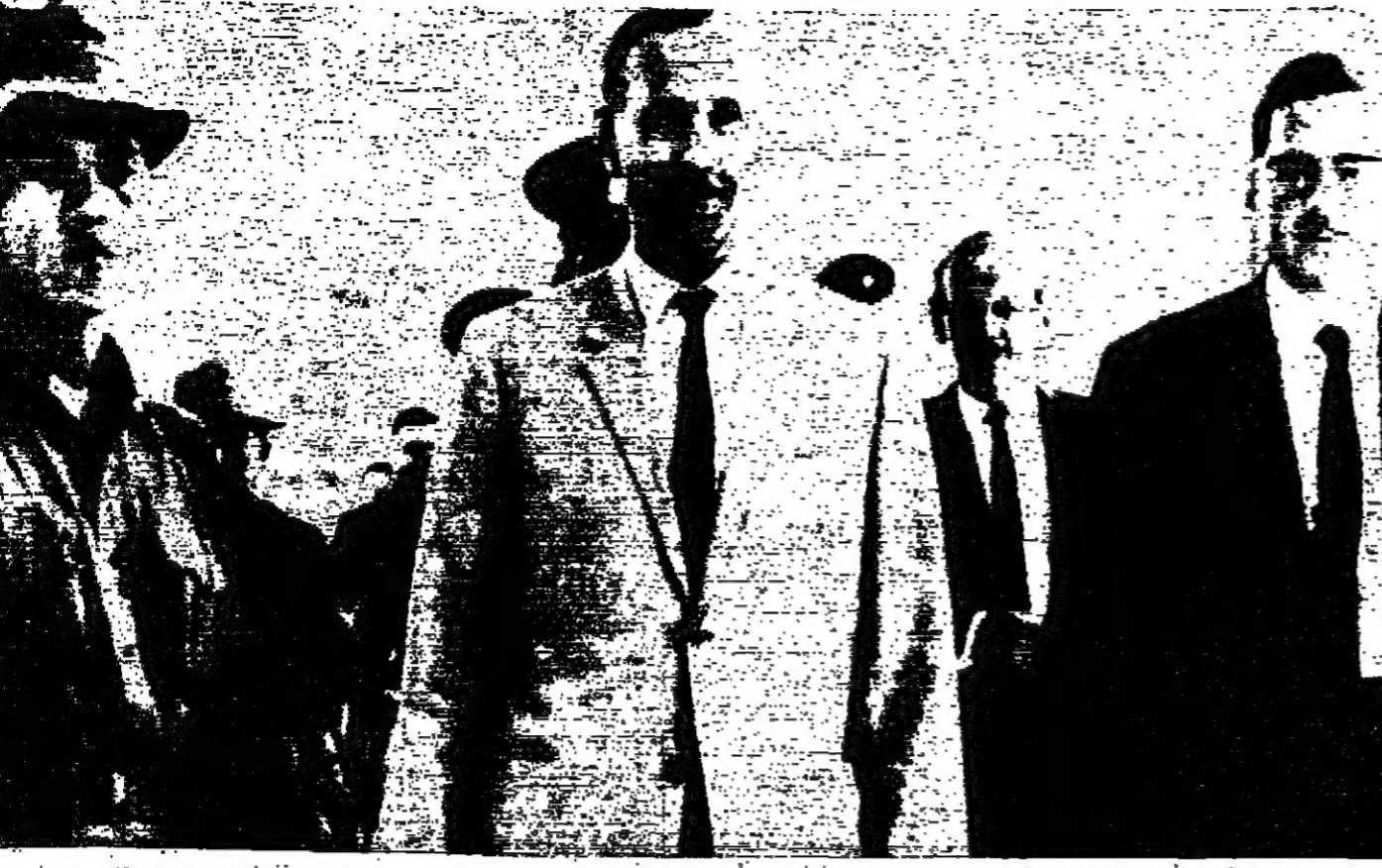
السردونالد هوسون القبولبالعمال البريطاني في بكين، مدير نقلة الحدوديين الصين الشعبية ومنظمة هونغ كونج بعد ان اباحت له سلطات بكين مغادرة البلاد. واليمين دونالد مخصمصبريطاني معروف في حزب «الكونغرس» وقد اذنت عليه الملكة بلقب «سير» نظراً لخدماته التي ابدتها حين احرقت القنصلية البريطانية في بكين في المصالح المسمى.